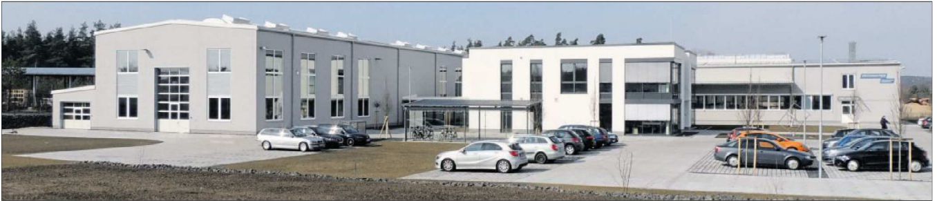
Die Firma „Zechmayer, Werkzeugbau-Formenbau“ hat ihren kompletten Standort in das Industriegebiet Hütten verlegt.