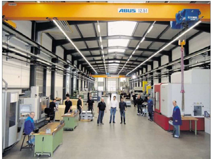
Die neue, 1200 Quadratmeter große Produktion gibt dem modernen Maschinenpark mit Fräs-, Erodier- und Bohrzentren ausreichend Platz.